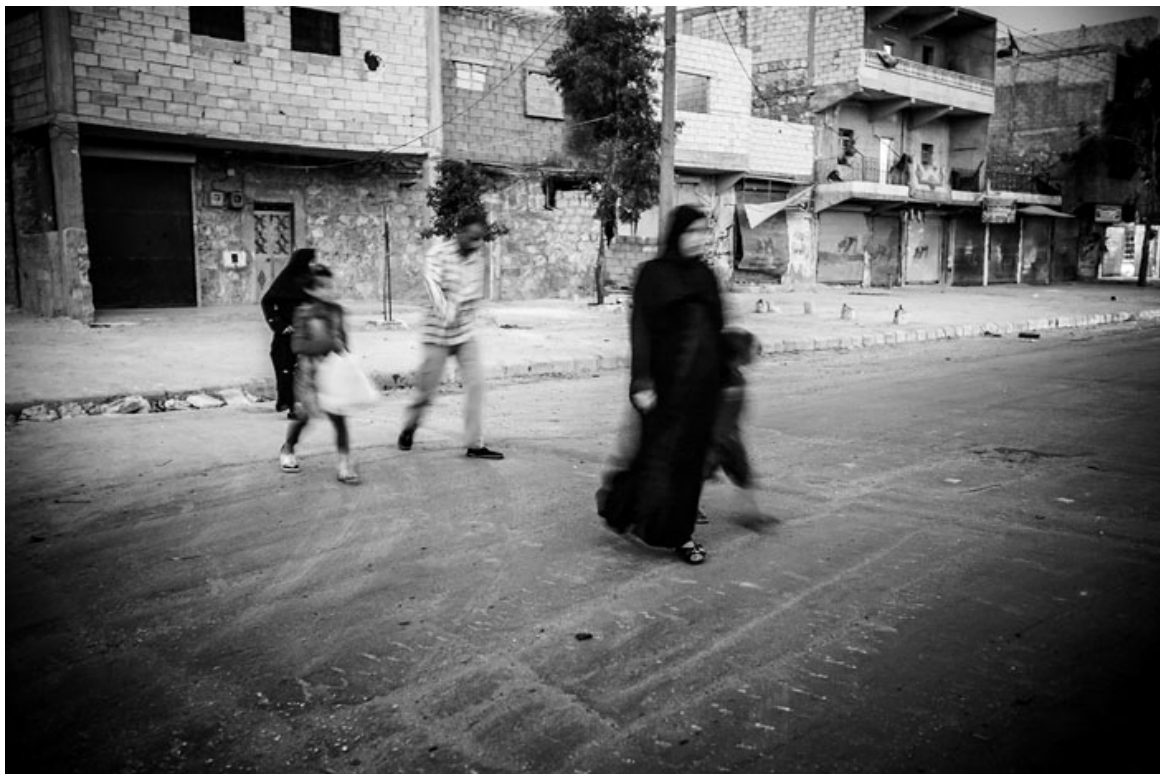
Pascal Mora, Syria www.moraphoto.ch <URL: http://www.moraphoto.ch >