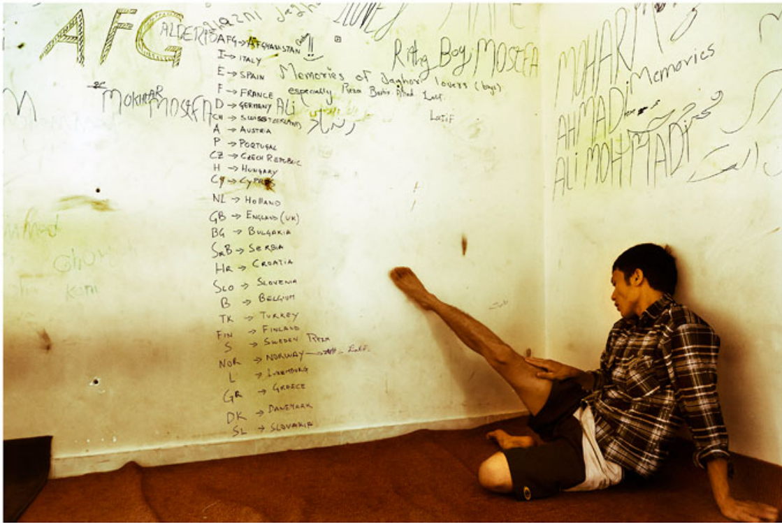
Kategoriepreisträger: Alberto Campi, Evros Border Fotopreis des Tages-Anzeiger