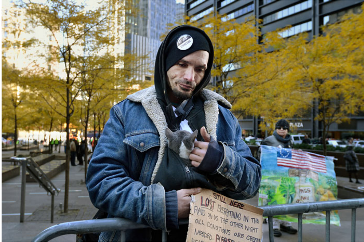
Christian Bopst, The End of Occupy Wall Street www.christianbobst.com <URL: http://www.christianbobst.com >